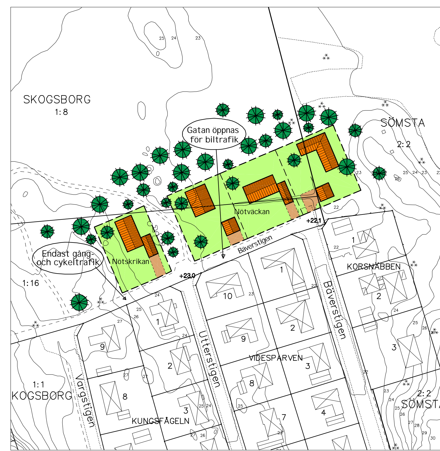
Illustration Skala 1:1000