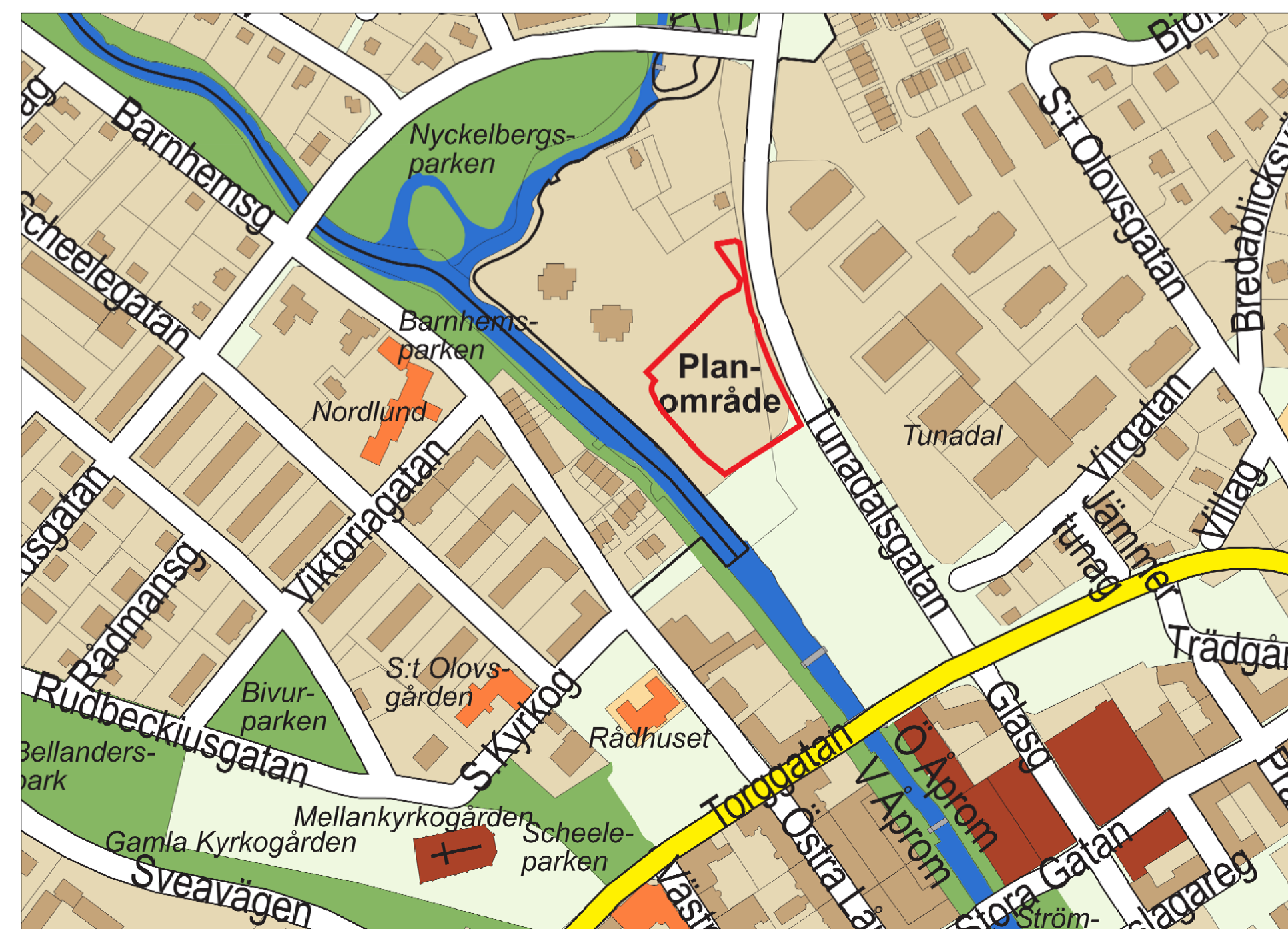
Upphävande av plan och fastighetsgränser Skala 1:1000